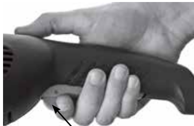
Botão Trava do gatilho

- Para facilitar a operação e evitar a fadiga do usuário durante aplicações contínuas de longa duração, a função de travamento do gatilho pode ser utilizada empurrando novamente a trava para cima, depois que a ferramenta já estiver funcionando. Para desabilitar esta função, basta pressionar o gatilho novamente.