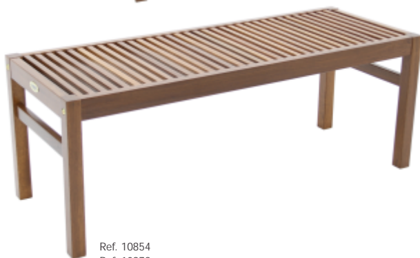
Ref. 10854 Ref. 10978